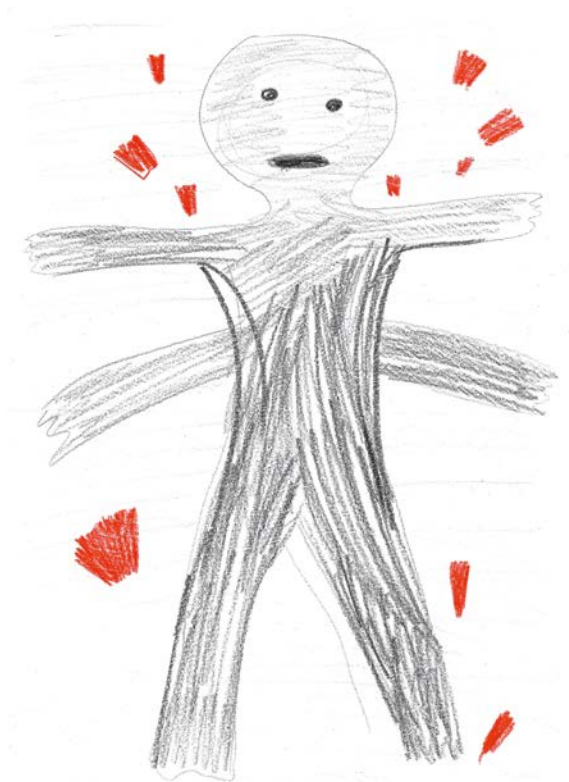
↑ Abb. 2: Personifizierung des Gefühls der Überforderung und inneren Unruhe