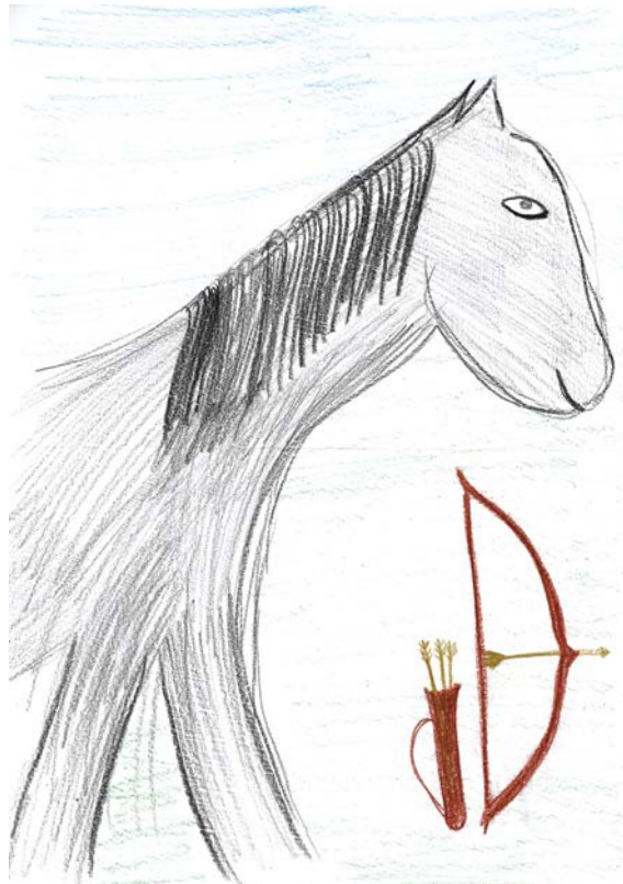
↓ Abb. 3: Personifizierung des Verbündeten, welchen die Klientin mit innerer Ruhe assoziiert bzw. ihr dazu verhilft